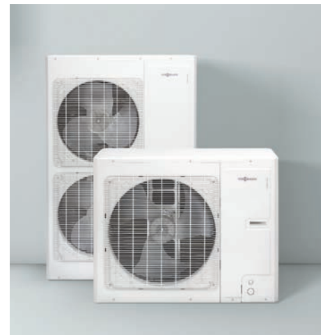
Unités extérieures Vitocal 100-S

L'utilisateur bénéficie de la simplicité d'utilisation du système de commande Vitotronic 200 : le menu de réglage est structuré de manière logique et facilement compréhensible, l'affichage rétroéclairé et contrasté permet une bonne lisibilité des informations. Une fonction d'aide contextuelle est à votre disposition en cas de doute. Vous pouvez à tout moment consulter votre consommation d'énergie en kWh pour le chauffage et l'eau chaude sanitaire, conformément aux exigences de la RT 2012.